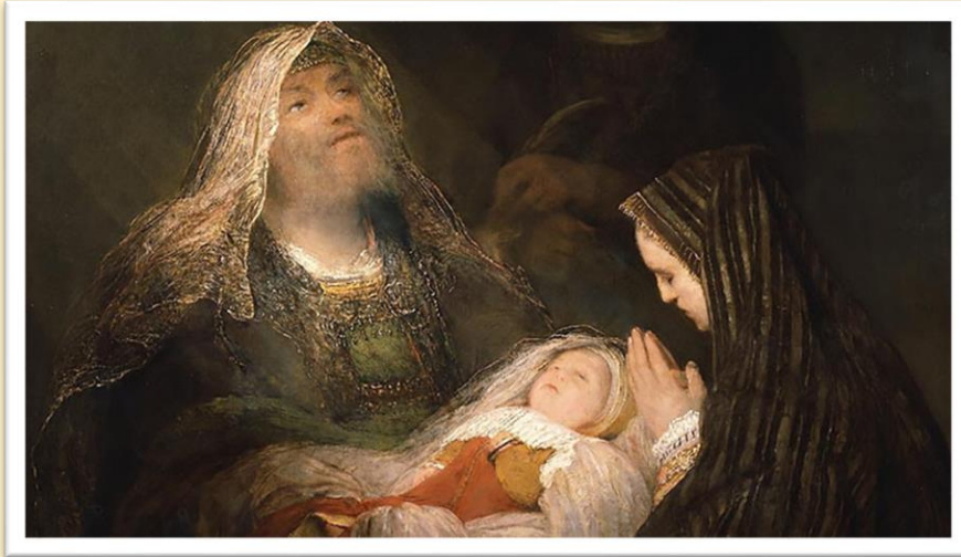
(Arent de Gelder 1700)