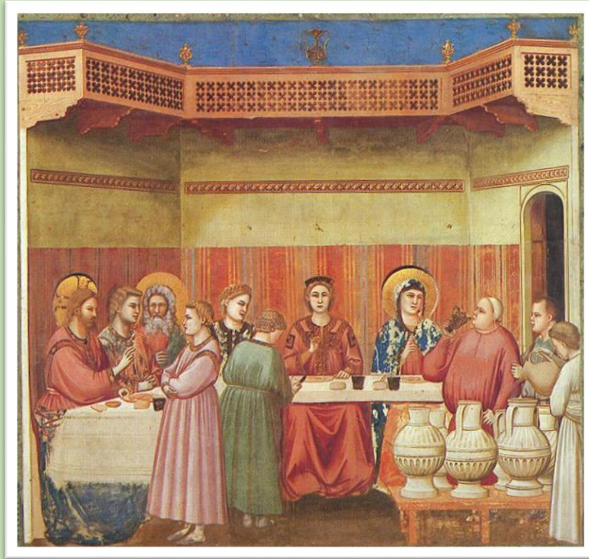
Giotto di Bondone ( les noces de Cana 1305)